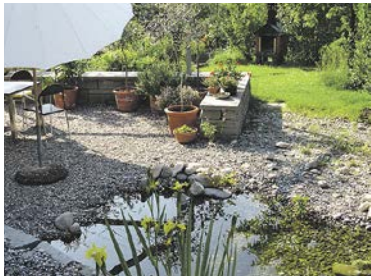
So sieht ein insektenfreundlicher Garten aus.