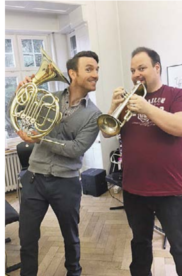
Welches Instrument darf's denn sein? Am Tag der offenen Tür der Musikschule geben Musiklehrpersonen Auskunft zur Instrumentenwahl... und natürlich kann dieses auch gleich selbst ausprobiert werden.

Die Musiklehrerinnen und Musiklehrer beantworten gerne Fragen zu Instrumentenwahl und Musikunterricht. Bei ernsthaftem Interesse am Musikunterricht kann