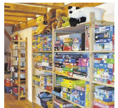
Die Spielzeugbörse ist offen.

► Die Spielzeugbörse ist geöffnet jeweils Di 14 bis 17 Uhr, Do 9 bis 12 Uhr, zweiter und letzter Samstag im Monat 10 bis 14 Uhr. Weitere Informationen www.spielzeug-zumikon.ch