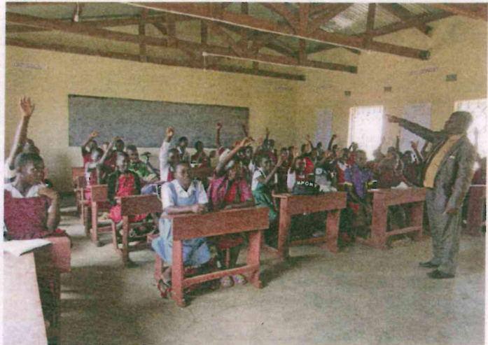
Die Klasse 8 in ihrem neuen Zimmer.

Schülerinnen und Schüler ein enormer Gewinn. So können sie regelmässig nach der Schule ihre Hausaufgaben erledigen. Dies war bis anhin in den Hütten ihrer Familien ohne Licht kaum möglich. Die Direktorin der Schule sprach in einem Interview von einem «erdbebenartigen Sieg» und bezog sich dabei auf die Erfolgsquote in den Prüfungen der Schülerinnen und Schüler.